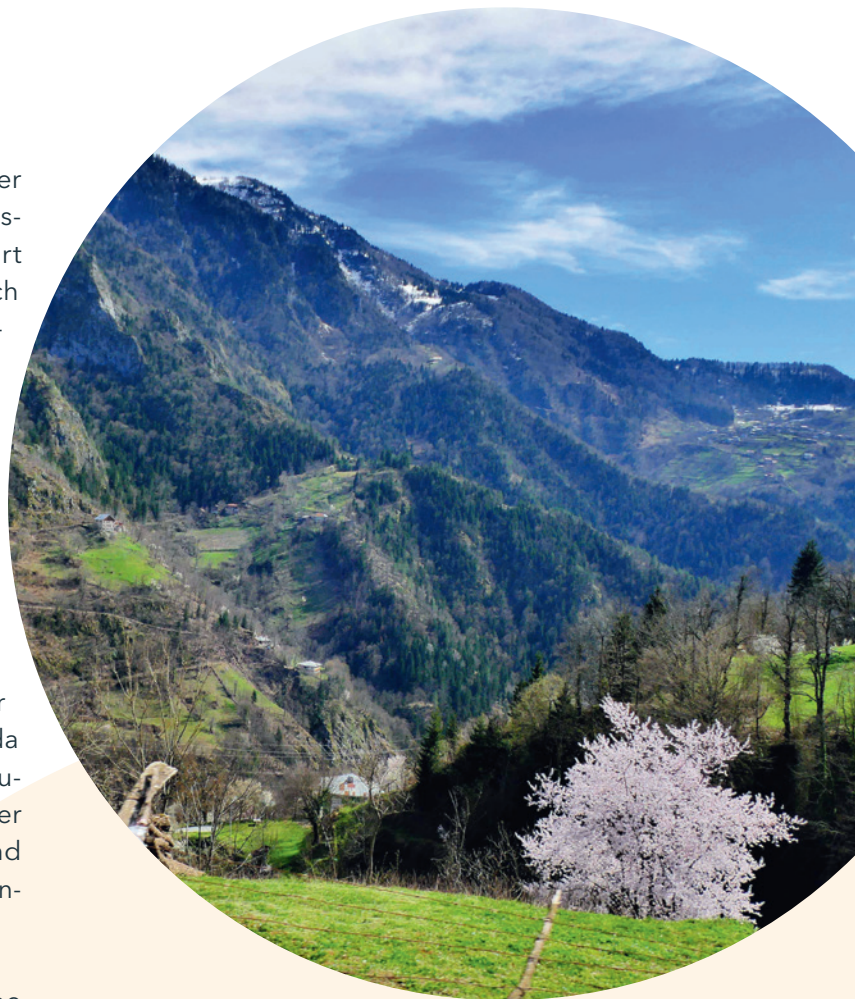
Westbalkan - Berglandschaft im Frühjahr

Abgerundet wurde das Projekt durch eine von HessenForst-Consulting organisierte Studienreise, bei der die Umsetzung der Themen im hessischen Forstbetrieb vorgestellt wurde. Das Projekt endete 2023.