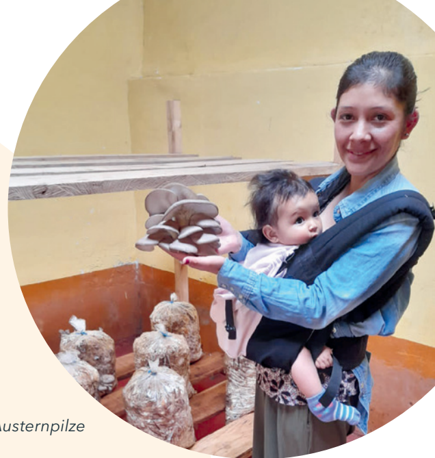
Ernte der Austernpilze

Das Projekt ermöglicht, den Schulkindern der beteiligten Projektschule sowie den Kindern