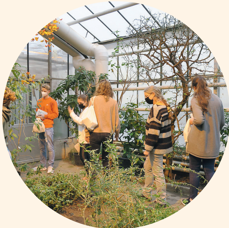
Pädagogische Fortbildungen für Lehrkräfte, Multiplikatorinnen und Multiplikatoren

Damit setzt das Projekt Ziel 4 der SDGs in besonderer Weise um.