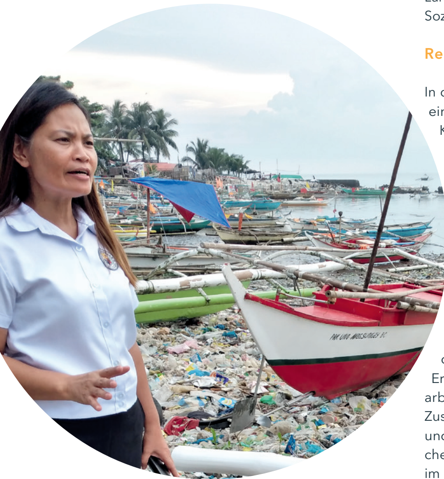
Auf der Suche nach einer Lösung für das Müllproblem

In fünf verschiedenen Stadtteilen von Bacolod werden – von örtlichen Müllsammlerinnen –