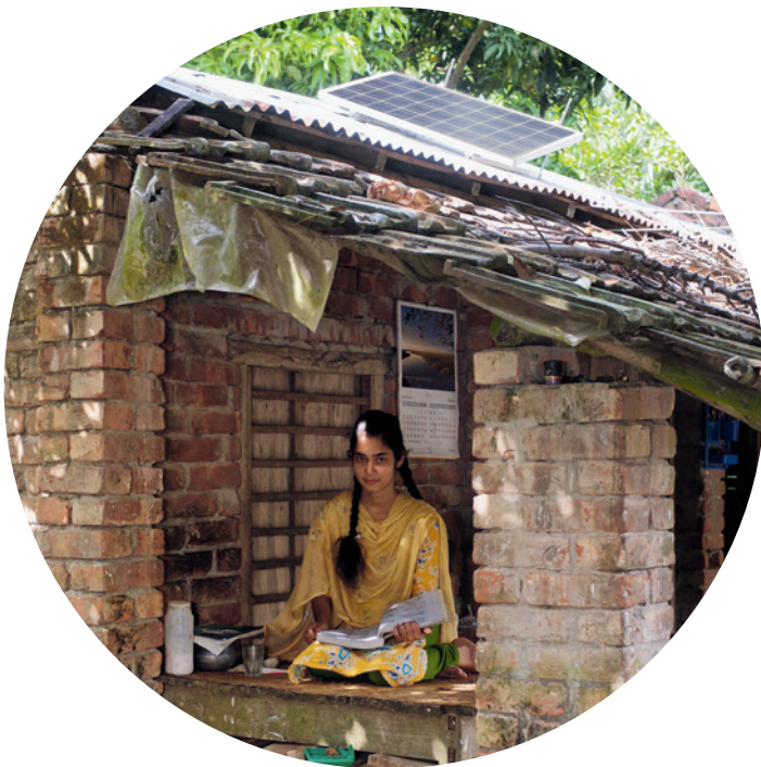
Bild 1 und 2: Klimaschutzprojekt Solaranlagen für zuhause in Bangladesch

Die Solaranlagen werden zu einem erschwinglichen Preis angeboten und die Menschen erhalten in den ersten drei Jahren einen kostenlosen Wartungs- und Reparaturservice. So trägt das Projekt dazu bei, Haushalte und Kleinstunternehmen in ländlichen Gebieten Bangladeschs mit Energie zu versorgen und die nachhaltige Entwicklung in verschiedenen Regionen des Landes voranzutreiben.