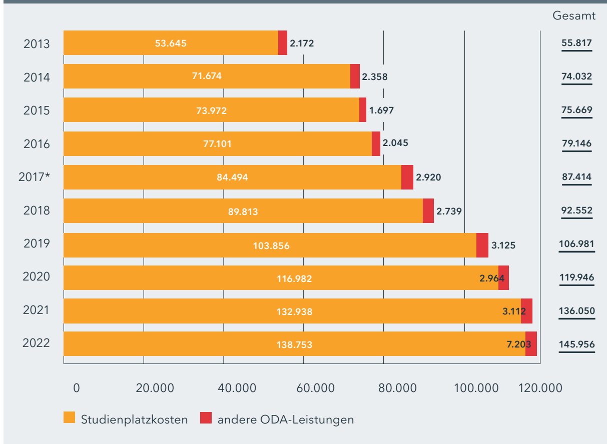
Abbildung 1: ODA-Leistungen Hessens 2013 bis 2022 (in Tausend EUR)

* Nach Veröffentlichung der Daten für das Berichtsjahr 2017 informierte Hessen darüber, dass die ODA-Leistungen ohne Studienplatzkosten im Jahr 2017 über die zunächst angegebenen 2,920 Mio. EUR hinaus insgesamt 3,414 Mio. EUR betragen hätten.