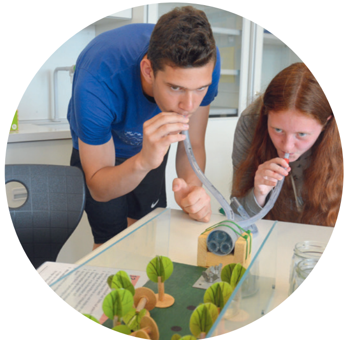
Experimentieren mit Windkraft

Im Rahmen des „Schuljahrs der Nachhaltigkeit“ wurde ein neuntes Lernmodul konzipiert und umgesetzt: Unter dem Titel „Mobilität - bitte