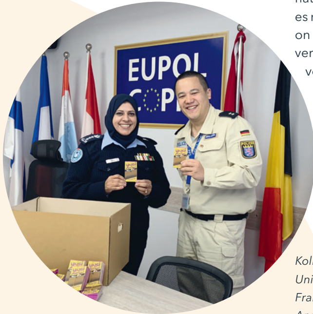
Kollegin von der Family Juvenile Protection Unit und Kriminaloberkommissar aus Frankfurt, entsandt von Januar 2022 bis April 2023

Das sowohl didaktisch als auch methodisch auf Nachhaltigkeit angelegte Programm fand nationale und internationale Anerkennung, da es mit der Tätigkeit eines zeitgleich in der Mission EUPOL COPPS tätigen hessischen Beamten vernetzt werden konnte und den Bediensteten vor Ort praktische Handlungsanleitungen vermittelte, die in Hessen entwickelt, an die örtlichen Gegebenheiten angepasst und nun weiter genutzt werden.