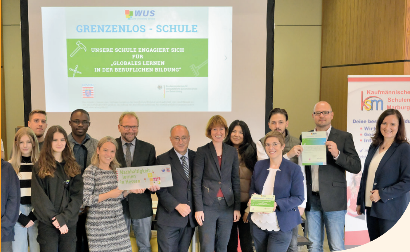
Grenzenlos-Schule KSM Marburg