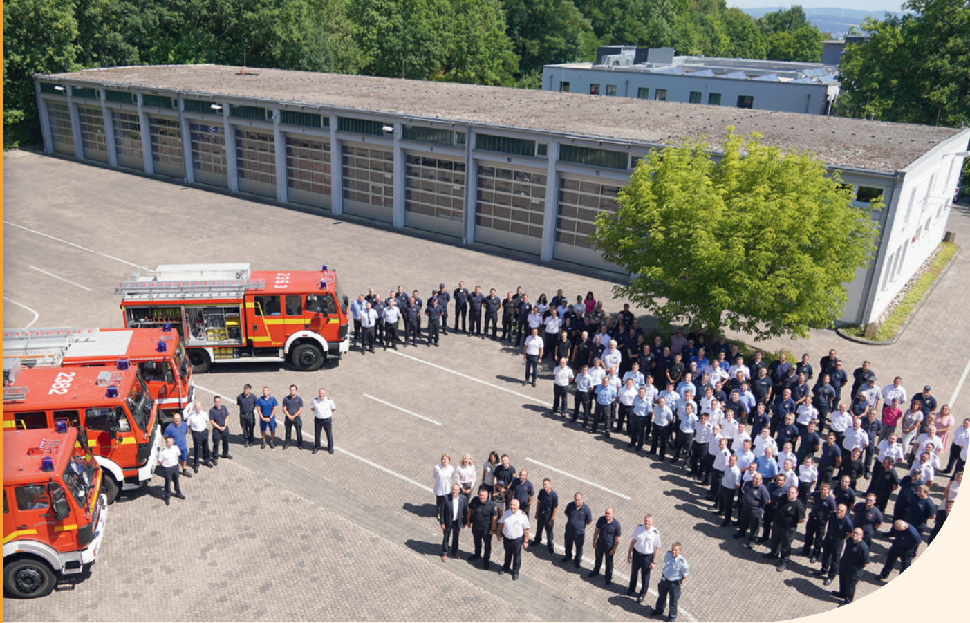
Übergabe von vier Einsatzfahrzeugen an der Landesfeuerwehrschule Hessen an ukrainische Einsatzkräfte (20.07.2022)