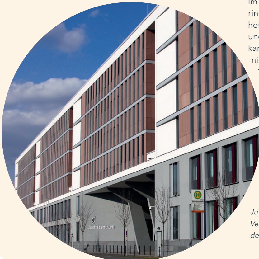
Justizzentrum in Wiesbaden mit Amts-, Land-, Verwaltungs-, Sozial- und Arbeitsgericht sowie der Staatsanwaltschaft

Auch für das Jahr 2023 hat sich das HMdJ bereit erklärt, Hospitantinnen und Hospitanten zu betreuen. Eine Zuweisung durch die IRZ erfolgte indes nicht.