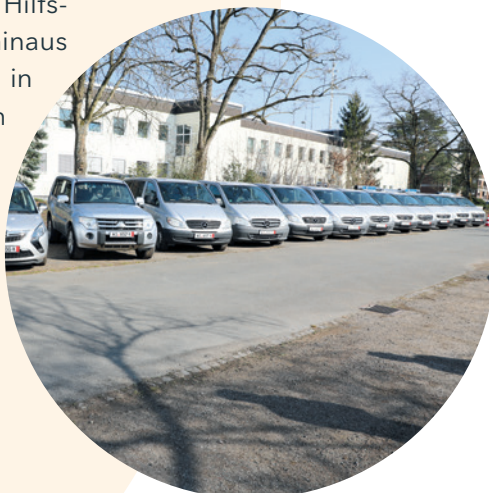
Ausgemusterte Fahrzeuge der hessischen Polizei, die bis heute in der Ukraine einen wichtigen Beitrag in der Logistik der dortigen Polizei leisten

Insgesamt wurden Hilfsgüter im Gesamtwert von über 300.000 Euro von der hessischen Polizei an die ukrainische Polizei übergeben.