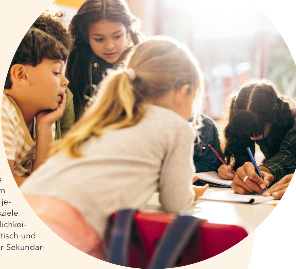
Grundschülerinnen und -schüler in einer Lerngruppe

In der thematisch freien Auseinandersetzung mit den SDGs werden Lösungsansätze für die ökologischen und ökonomischen Herausforderungen unserer Zeit erarbeitet; dies erfolgt gleichzeitig durch die Auseinandersetzung mit technologischen Neuerungen, um Schülerinnen und Schüler für die Nutzung von digitalen Medien zu sensibilisieren.