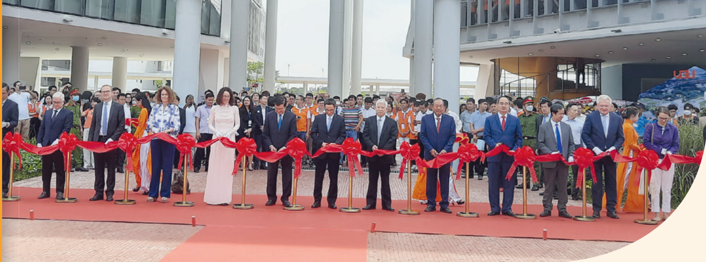
Campus-Eröffnung der VGU, Nov. 2022